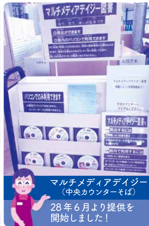
マルチメディアデイジー (中央カウンターそば)