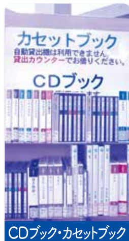
CDブック・カセットブック