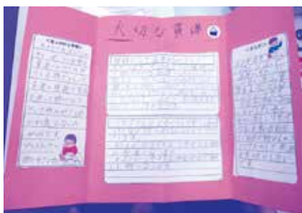
調べ学習の学習成果 「テトラリーフレット」の完成 テーマ「大切な資源」