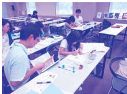
小学校司書より、サポートを受けながらの「調べ学習」