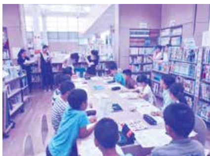
県立図書館司書より「資料の探し方」について学ぶ様子