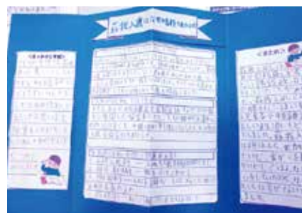
調べ学習の学習成果 「テトラリーフレット」の完成 テーマ「蘇我入鹿はなぜ暗殺されたのか」