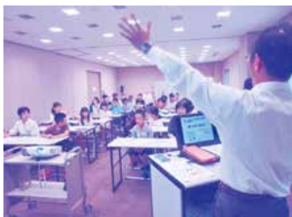
講師より「調べ学習の進め方」について学ぶ様子

今回の学習をきっかけとして、資料を使った学習を身につけ、どんどん疑問を解決しながら学習を進めていただけたらと願っています。