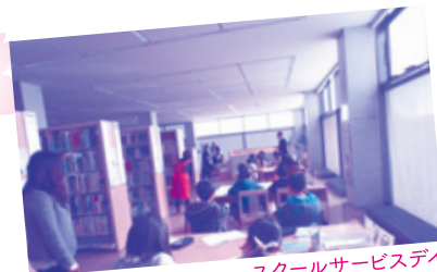
スクールサービスデイ