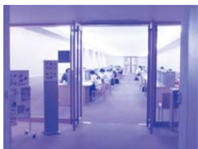
学習室は毎日開館